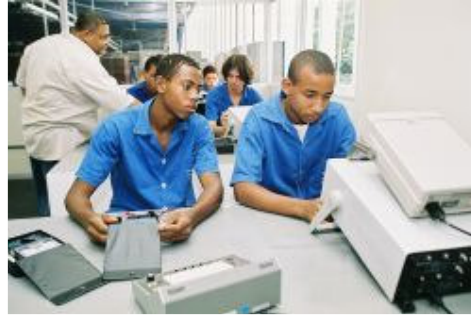
Escola SENAI Campos

Durante os momentos presenciais são desenvolvidas práticas nos laboratórios existentes na rede SESI-SENAI, além da revisão dos conteúdos estudados a distância; assim, unindo o estudo a distância e as aulas presenciais, pretende-se garantir o desenvolvimento das competências necessárias.