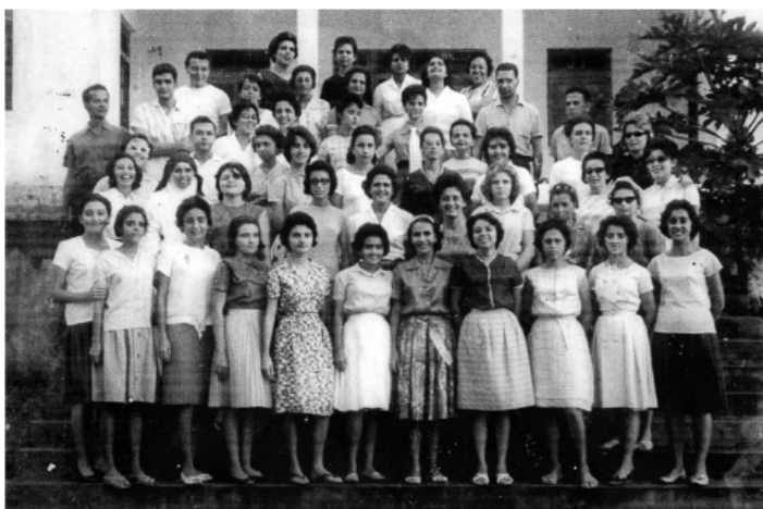
Equipo nacional, equipo estatal y supervisores seleccionados para actuar en el MEB.