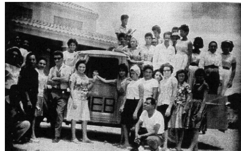
Supervisores visitando escuelas radiofónicas en el interior del municipio de Petrolina.