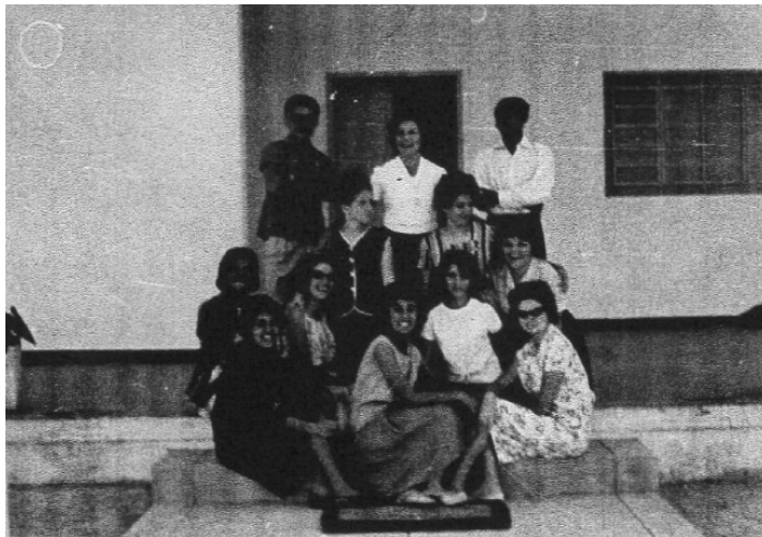
Personas reclutadas para el MEB de Petrolina- PE y de Juazeiro – BA.